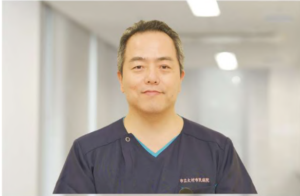
副院長 兼 医療技術部長 兼 婦人科科長